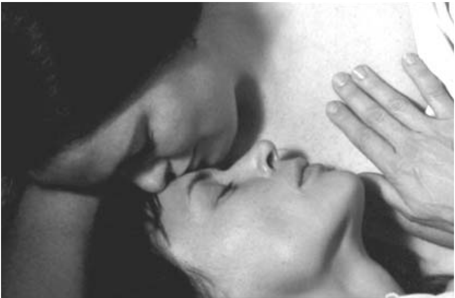
Az egység élmény utáni vágy (Bergman, 1971)

Anna azt mondja, felidézve édesanyja jelenlétét, hogy most már felnőttként érti anyja közönyét, türelmetlenségét, sóvárgását, magányát. Hogy ez nem miat-