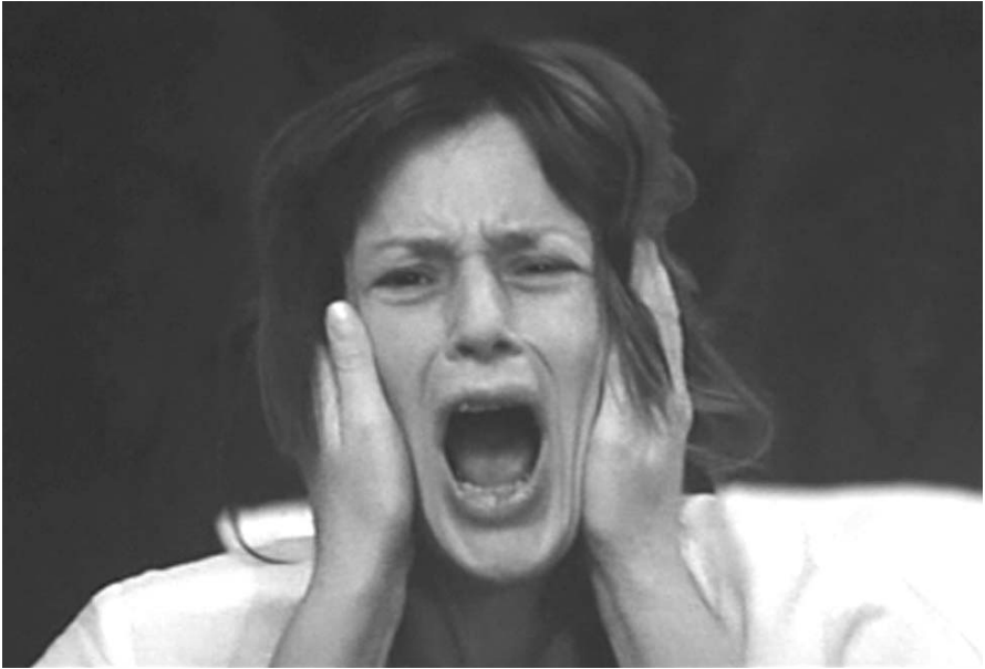
Ágnes fájdalommal „születik” meg (Bergman, 1971)

József Attila verse Jordán Tamás extatikus, már-már hisztérikusan felfokozott, expresszív előadásában elviselhetetlen fájdalmat fejez ki. Türelmetlenséget, dühöt, iszonyú haragot, agressziót. Csillapíthatatlan és késlekedést nem tűrő türelmetlenség, a magára hagyott gyerek anya utáni vágya kiált e szavakkal. Egy felnőtt férfi, aki átéli a hiányt, az ezzel kapcsolatos fájdalmat és vágyat, a gyermeki magárahagyatottság kínjával küzd, és a szeretve levés által remél és követel fájdalmat csillapító enyhülést.