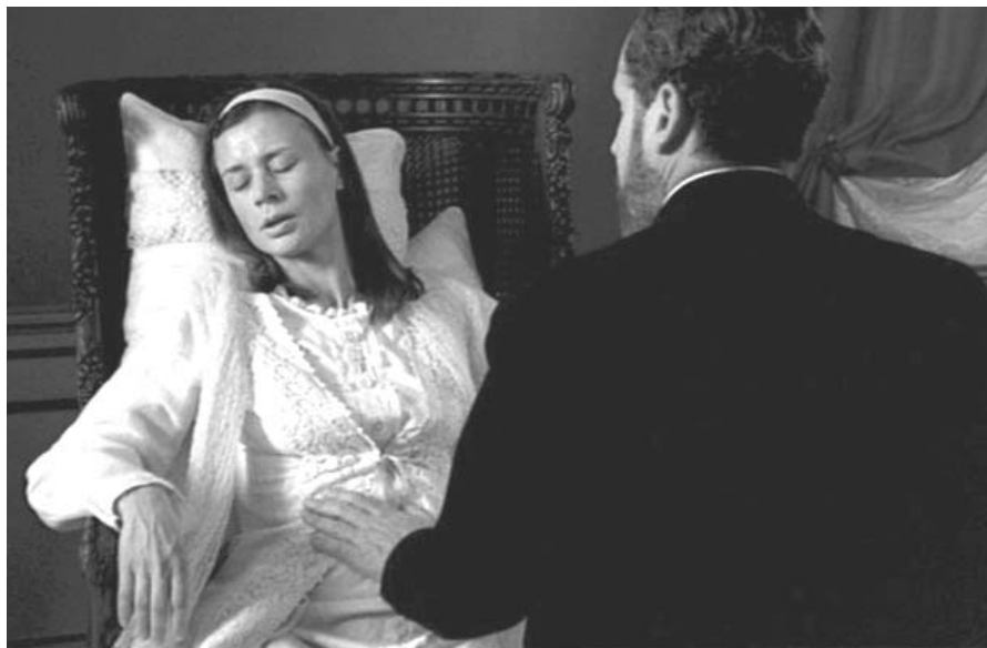
Az orvos látogatása (Bergman, 1971)

Majd vizsgáló kezét Ágnes hasára teszi, mint a szülész, aki a terhességet, vagy akár a daganatot keresi. Mert Ágnes talán a fájdalommal terhes, amit megszüülhet halálával, de az orvos kezét megragadva a szívére vonja, jelezve, hogy ott a baj, a fájdalom helye. És a fájdalmat a rész-vét tudná csillapítani. A doktor azonban orvosi szerepéből nem tud, nem mer kibújni, mert szembe kellene néznie saját félelmeivel, viszonyával az élethez és a halálhoz, a szeretés képességéhez. Önzése, magánya, mely hasonlatos a csehovi orvos-hősohkhöz csak az atyai arc-paskolást engedi meg, és az ebben kifejeződő, reményt hazudó gyávaságot, amely nem mer szembenézni a halál magányával, az egzisztenciális egyedülléttel.