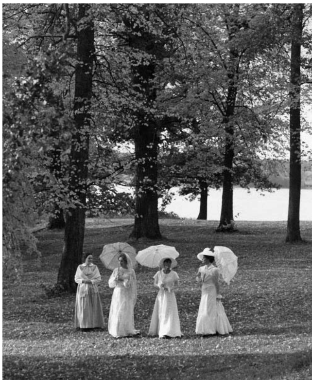
Három nővér a „Suttogások, sikolyok”-ban (Bergman, 1971)

Idő a századforduló, színhely egy egykoron gazdag vidéki kastély. Szülei halála óta Ágnes egyedül él ott Annával, a szolgálólánnyal. Két évvel idősebb nővére és húga férjnél van, gyerekeik vannak. Most Ágnes betegsége miatt jöttek vissza gyermekkoruk színhelyére.