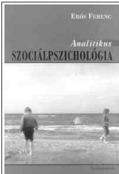
Erős Ferenc: Analitikus szociálpszichológia . Új Mandátum, Bp. 2001.

Ma már talán nem szorul külön igazolásra – Magyarországon sem – az analitikus szociálpszichológia létjogosultsága. A pszichoanalízis ugyanis egyike a modernitás nagy kulturális narratívumainak. Freud fellépése a tizenkilencedik század végén nem csupán egy lélektani felismerést, a tudattalan felfedezésének tetetőzését és egy új terápiás eljárás, a terapeuta és a páciens dialógusán alapuló gyógy mód kidolgozását jelentette, hanem egy diszkurzívítás megalapozását is. Freud – Michel Foucault kifejezésével – azon szerzők közé tartozik, akik „megteremtették más szövegek kialakításának lehetőségét és szabályait”, és „diskurzusok végtelen lehetőségét” hozták létre. Az ilyen szerzők Foucault szerint „teret nyitottak valaminek, ami más, mint ők és mégis beletartoznak abba a diskurzusba, amelynek ők voltak a kezdeményezői”.